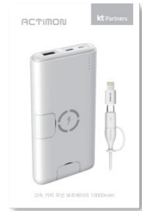
· 브랜드 : ACTIMON