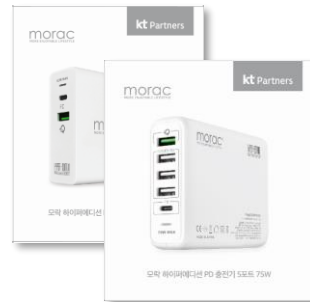
· 브랜드 : morac