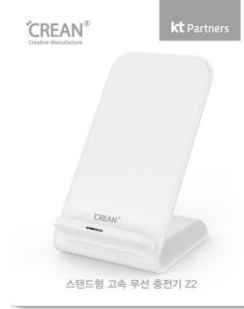
· 브랜드 : CREAN