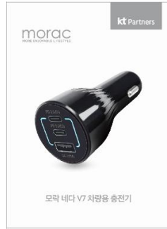
브랜드 : morac