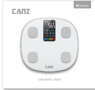
브랜드 : CANZ