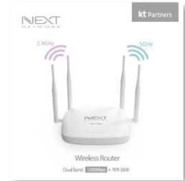
· 브랜드 : NEXT