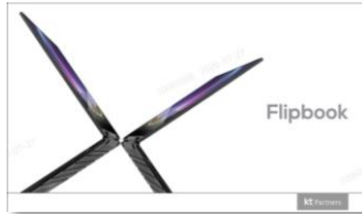
브랜드 : Flipbook